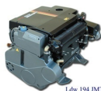
Ldw 194 JMT